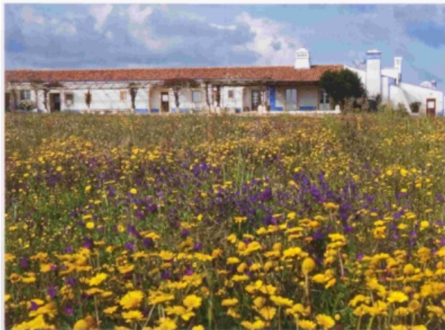
En el cuerpo central del hotel, lo que era la antigua casa de labos, se añaden algunas de las habitaciones. Todas ellas cuentan con salida directa al jardín.

S ientes con unas vacaciones? ¿Tienes ganas de olvidarte del estrés, las penas, el trabajo? ¿Quieres vivir unos días a cuerpo de rey? Pues sigue leyendo porque nos vas a acompañar a un destino en el que se cumplirán todos tus deseos y, además, puede salirte gratis. Si has leído bien, gratis. Nos dirigimos a la zona más occidental del Alentejo portugués, a Zambujal da Mar, donde se encuentra la Herdade do Toural , un hotel delicioso para disfrutar en cualquier época del año. En verano, gracias a su piscina en forma de alberca alemana y a su fantástica playa propia, y en invierno, en su salón que cuenta con una lujosa chimenea y resulta muy acogedor.